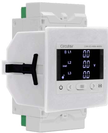
CVM-E3-MINI mit Frontadapter 72 x 72